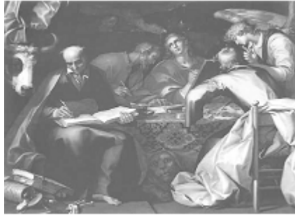
17 వ శాతబ్ద ప్రసిద్ధి చెందిన చిత్రపటము

లూకా 1:-4 నుండి సువార్తలు ఏ విధంగా వ్రాయబడ్డాయో తెలుసుకోండి.