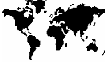
உலகத்தின் எல்லா தேசங்களும்

ஈசாக்கைப் பெற்றாள். இவ்வாறு தேவன் தமது வாக்குத்தத்தத்தை நிறைவேற்றினார். இந்நாள் வரையிலும் ஆபிரகாமின் சந்ததியில் வந்த இயேசுவின் மூலம் உலகத்தின் எல்லா ஜனங்களையும் தேவன் ஆசீர்வதித்துக் கொண்டே இருக்கிறார் (ஆதி. அதி. 15, 17 & 21).